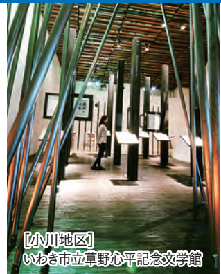
[小川地区] いわき市立草野心平記念文学館