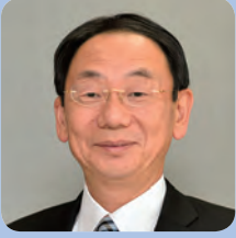
穂積 志 (ほづみ もとむ)

1957年生まれ。秋田市出身。82年成蹊大学法学部卒業。87年秋田市議会議員当選(1期)。95年秋田県議会議員当選(4期)。09年4月から現職(現在2期目)。現在、全国市長会相談役、秋田県市長会会長。