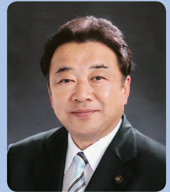
いわき市長 清水 敏男 (しみず としお)