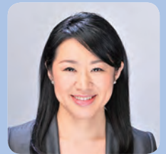
越 直美 (こし なおみ)

1975年生まれ。大津市出身。00年北海道大学法学部卒業。司法試験合格。01年北海道大学大学院法学研究科修士課程修了。02年から弁護士として日米の法律事務所に勤務。09年ハーバード大学ロースクール修了。10年コロンビア大学ビジネススクール客員研究員。12年1月から現職(現在2期目)。中核市市長会監事