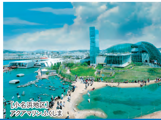
[小名浜地区] アクアマリンふくしま