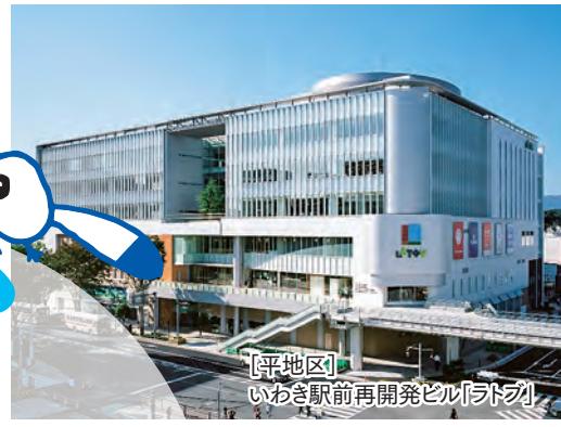
[平地区] いわき駅前再開発ビル「アトリウム」