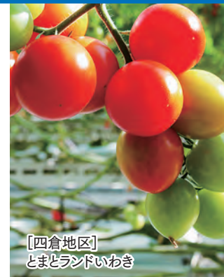
[四倉地区] とまとランドいわき