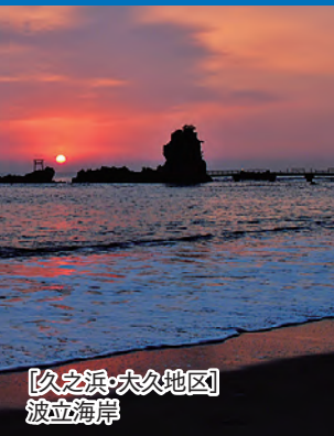
[久之浜・大久地区] 波立海岸