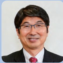
田上 富久 (たうえ とみひさ)

1956年生まれ。五島市出身。80年九州大学法学部卒業。同年、長崎市勤務。02年観光振興課主幹、04年統計課長。07年4月から現職(現在3期目)。現在、日本非核宣言自治体協議会会長、平和首長会議副会長、全国市長会相談役、長崎県市長会会長。