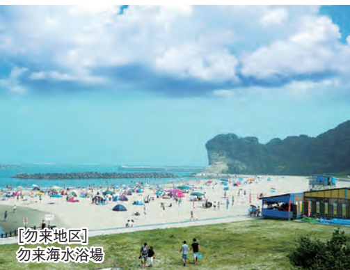
[勿来地区] 勿来海水浴場