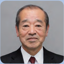
檜原 利則 (ならはら としり)

1948年生まれ。福岡県出身。71年西南学院大学商学部卒業。同年久留米市勤務。00年環境部長、03年総務部長、07年副市長を経て、10年2月から現職(現在2期目)。現在、福岡県市長会会長。