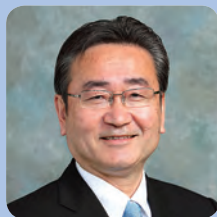
石森 孝志 (いしもり たかゆき)

1957年生まれ。八王子市出身。80年明星大学人文学部卒業。95年から八王子市議会議員(3期)、05年から東京都議会議員(2期)、12年1月から現職(現在2期目)。