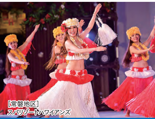
[常磐地区] スパリゾートハワイアンズ