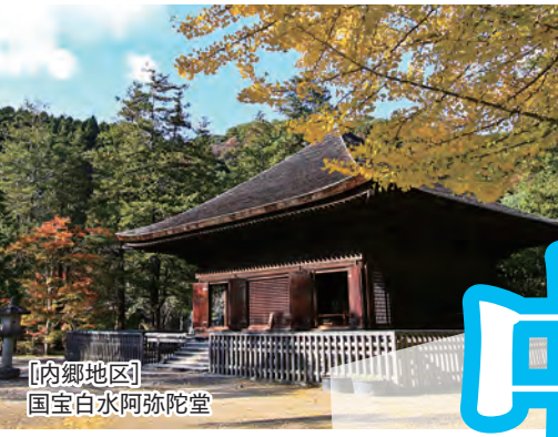
[内郷地区] 国宝白水阿弥陀堂