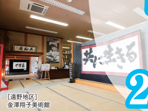
[遠野地区] 金澤翔子美術館