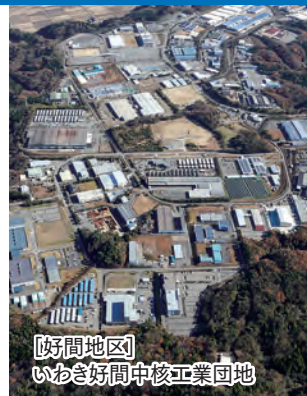
[好間地区] いわき好間中核工業団地