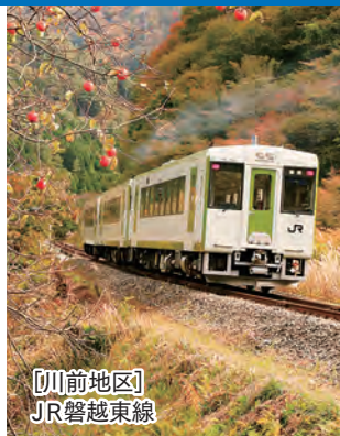
[川前地区] JR磐越東線